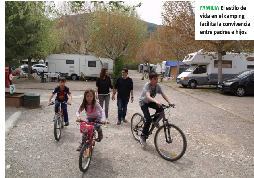
FAMILIA El estilo de vida en el camping facilita la convivencia entre padres e hijos

con la naturaleza, tenemos tranquilidad y nuestros hijos ganan en autonomía y sociabilidad. Los niños pueden ir y venir libremente y hacer cosas que normalmente no hacen en casa por falta de tiempo, como lavar platos o comprar en la tienda. Desde el camping también podemos disfrutar del entorno y hacer excursiones a pie o en bicicleta, viendo paisajes diferentes y haciendo deporte.