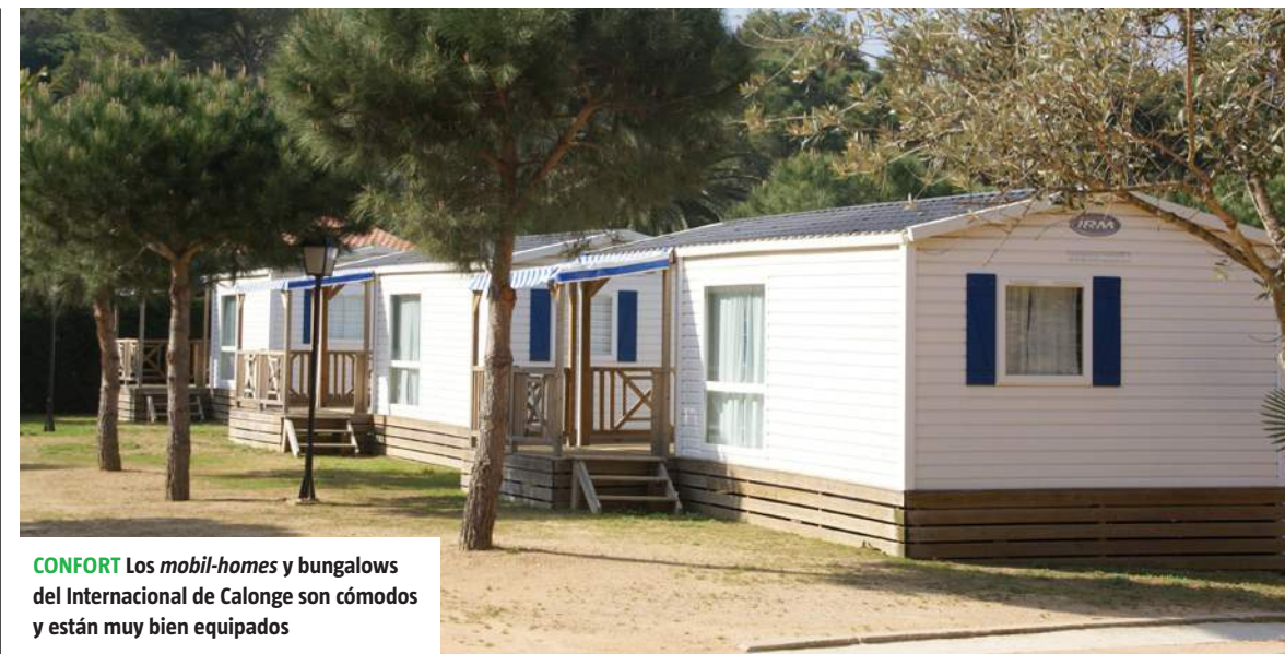
CONFORT Los mobil-homes y bungalows del Internacional de Calonge son cómodos y están muy bien equipados

Sus completas instalaciones de ocio incluyen un complejo central de piscinas, parques infantiles, pistas de tenis y polideportivas, mini-club, supermercado, bar-restaurante, take away y un amplio programa de animación de Semana Santa a septiembre, con actividades para toda la familia. Destaca en especial su Sport Club, con propuestas para