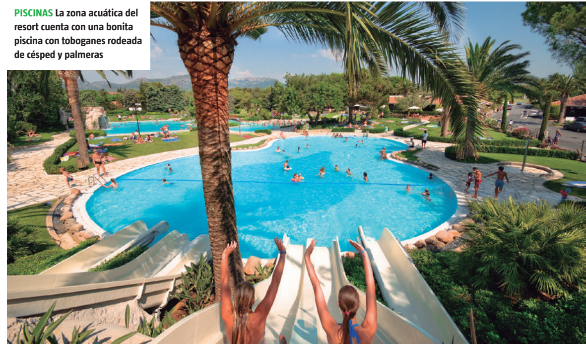
PISCINAS La zona acuática del resort cuenta con una bonita piscina con toboganes rodeada de césped y palmeras

descanso y relax a escasos metros de la playa y no lejos de las piscinas climatizadas.