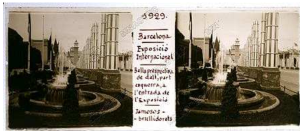
Exposició Internacional de Barcelona (1888); negatiu

L'usuari pot veure les imatges, consultar informacions com el lloc, la data i el moment a què pertanyen, filtrar la seva cerca per diferents criteris (tema, paraula clau, municipi, etc.) i, fins i tot, descarregar en alta resolució les més actuals (fons institucional). El fons consultable anirà creixent mica en mica, fins a assolir la totalitat de l'arxiu.